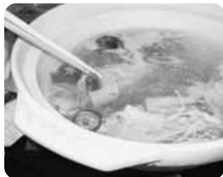
～家庭で簡単に作れる老舗料理長伝授のレシピ～

鰯……………適量 お好みの野菜……………適量 昆布だし……………適量 〔 昆布……………適量 水……………適量 ポン酢たれ……………少々 〔 レモン汁……………1個分 酢……………適量 しょうゆ(濃い口)……………適量 ※お好みの味に仕上げる。 薬味(ねぎ、もみじおろしなど) ……………適宜