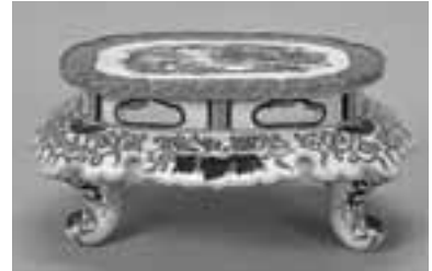
陶磁器「色絵龍桐文木瓜形平卓」 粟生屋源右衛門

本展では「池田コレクション」より、絵画・工芸・彫刻など様々な作品を約50点紹介予定です。