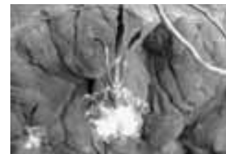
蝶の形をした 別名バタフライオーキッド