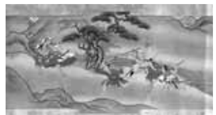
絵画「太平記 大森彦七物語」 江戸時代制作

■お問い合わせは TEL 53-1500 FAX 53-6262 http://www.city.nanao.lg.jp/nanabi/