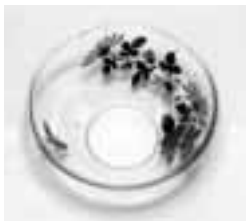
型吹き彩絵菊蝶文ガラス碗 江戸時代後期 美光びいどろコレクション蔵

皆さまのご要望 に応え、江戸時代、 日本で作られた繊 細優美な吹きガラ スや緻密にして豪 華な切子のガラス 器をご紹介します。