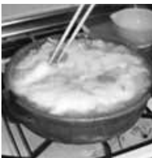
最優秀賞 「五色つみれ雪み鍋」 鍋が煮立ったら、最後にとろろをふんわりとかけ、柚子で香り付けしてできあがり!