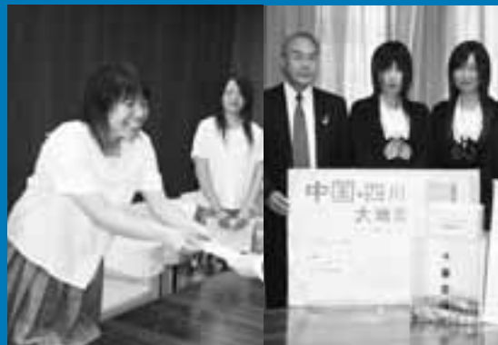
6月4日(鷺学園高校の生徒:右) 6月10日(田鶴浜高校の生徒:左)

5月12日に発生した中国の四川大地震により、被害を受けた被災者へ向けて、市内の高校生をはじめとする各団体の方が、募金活動を行い、日本赤十字社に預託しました。