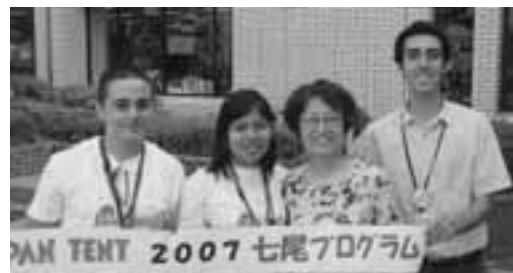
ホストファミリーの方と、思い出の記念撮影も(昨年撮影)

※お申し込み・お問い合わせは 男女参画まちづくり課 国際交流係 ☎53-8448