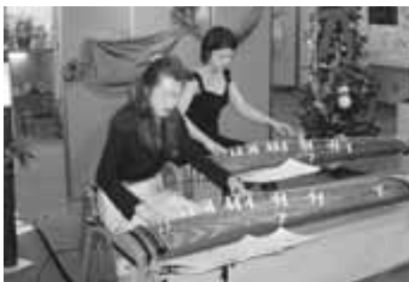
「市民のねがい」から感じた思いを語り、奏でるコンサートの様子

「市民のねがい」ふれあいコンサートでは、ボランティアで演奏してくださる方を募集しています。