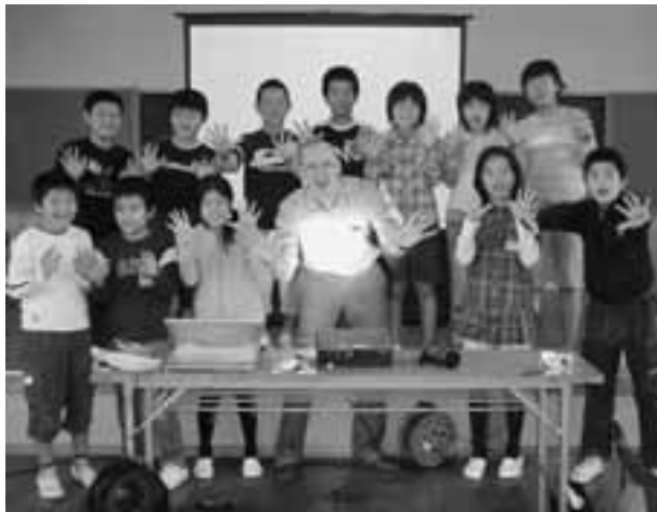
山王小学校のみんなと山王小学校のWA!!