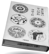
「家計簿の中の昭和」 澤地 久枝 文藝春秋