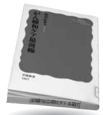
「がん緩和ケア最前線」 坂井 かをり 岩波書店