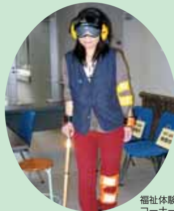
福祉体験コーナー