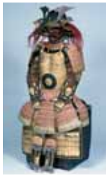
「紅糸威仁王胸具足」石川県立歴史博物館蔵