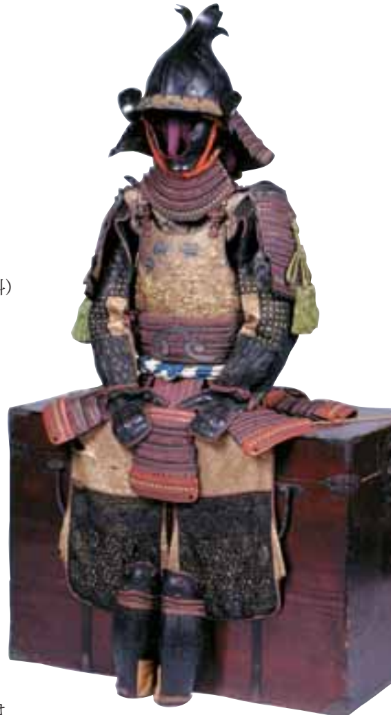
「紫紺糸威二枚胸具足」石川県立歴史博物館蔵