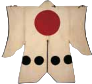
「日の丸陣羽織」石川県立歴史博物館蔵