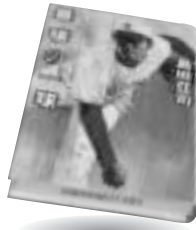
「最後の一球」 島田 荘司 原書房