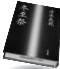
「冬至祭」 清水 義範 筑摩書房