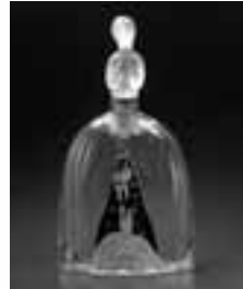
香水瓶「誘惑」 パレーラ社 (スペイン) 1920年頃 高砂香料コレクション

古代から現代までの華麗な香りのガラス器80点をご紹介します。香り体験コーナーもあります。この機会に香りとガラスの世界をお楽しみください。