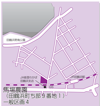
馬場農園 (田鶴浜町ち部9番地1) 一般区画4