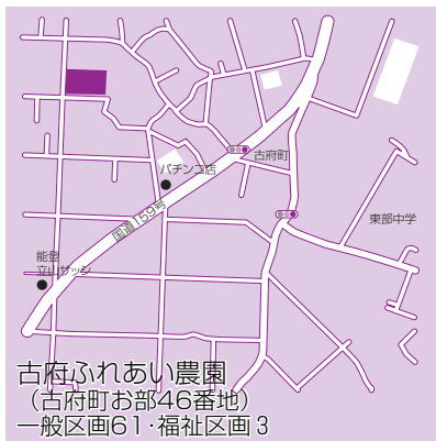
古府ふれあい農園 (古府町お部46番地) 一般区画61・福祉区画3

市内には、現在3つの市民農園があります。市民農園では、作物を栽培することで、自然に触れ土に親しみ、農業の大切さを体感することができます。また、利用者同士や、地域の方との交流も生まれています。