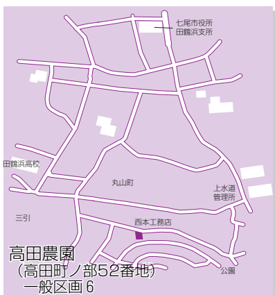
高田農園 (高田町ノ部52番地) 一般区画6