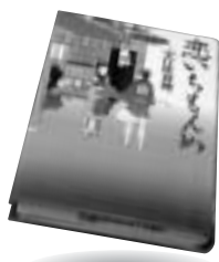
「恋いちもんめ」 宇江佐真理 幻冬舎