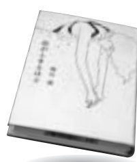
「息がとまるほど」 唯川 恵 文藝春秋