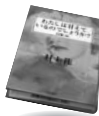
「わたしは甘えているのでしょうか?」 村上 龍 青春出版