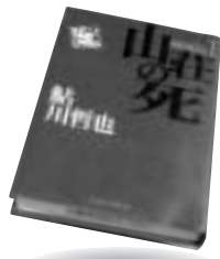
「山荘の死」 鮎川哲也 出版芸術社