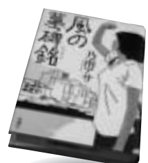
「風の墓碑銘」 乃南アサ 新潮社