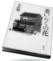
「老いらくの花」 小沢昭一 文藝春秋