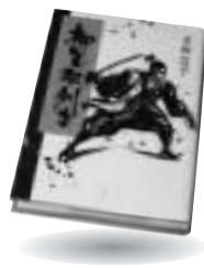
「柳生双剣士」 多田 容子 講談社