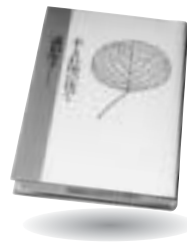
「木もれ陽の街で」 諸田 玲子 文藝春秋