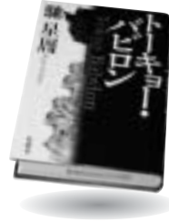
「トキョー・バビロン」 馳 星周 双葉社