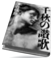
「千秋の讃歌」 落合 信彦 集英社