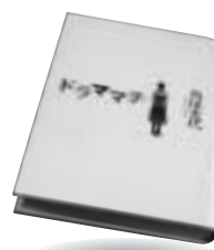
「ドラママチ」 角田 光代 文藝春秋