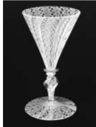
レースガラスゴブレット ヴェネチア17～18C サントリー美術館蔵

16世紀から19世紀にかけて制作された繊細で華麗なガラス器や、現代ガラス作家の創造性あふれるレース模様のガラス器など、約40点を展示します。