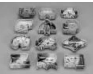
「織部寄向附」 桃山～江戸初期

時には写実的にその物を写し取り、時にはそのイメージによって抽象的に表現された色々な形。