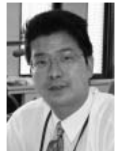
七尾市地域雇用創出協議会 （産業政策課内）