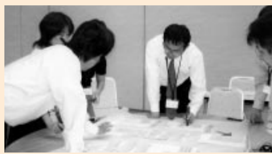
わたしたちと一緒に考えませんか？

開催日時 10月29日(土) 午前10時～11時45分 場 所 七尾市役所中島支所 多目的ホール 演 題 「市民憲章とまちづくり」 講 師 高岡 完治 氏 (あしたの日本を創る協会理事長)