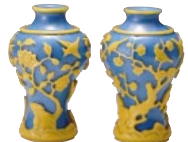
「青地黄被花鳥文瓶」 清朝18世紀