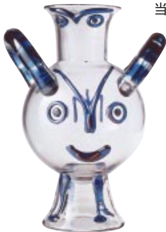
「おどけたフクロウ」パブロ・ピカソ、 エジディオ・コスタンチーニ 1962年