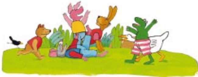
「かえるくんはかなしい」より マックス・ベルジュイス(オランダ)

世界中から応募のあった絵本原画公募展の入選作、84人の411点がイタリアから届きました。今年は「かえるくん」シリーズで知られるマックス・ベルジュイスの原画24点に加え、これまでの入選作家約100人の直筆絵紙と絵本も特別展示。 楽しい絵本もたくさんあるよ!!