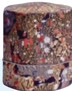
飾筒「紅白梅」 藤田喬平 1992年