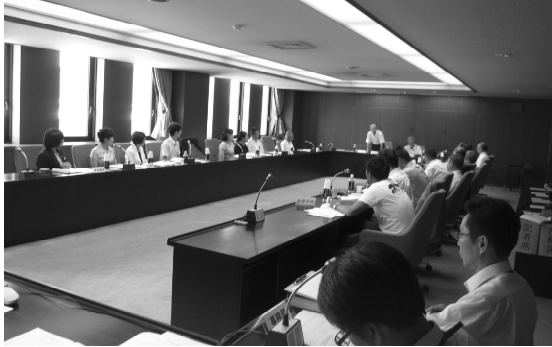
■ 第1回七尾市総合計画審議会 (2017.7)