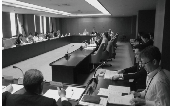
■ 第2回七尾市総合計画審議会 (2017.9)