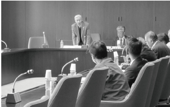
■ 第3回七尾市総合計画審議会 ■ 第3回七尾市総合計画審議会 部会 (2018.2)