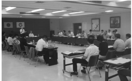
■ 第4回七尾市総合計画審議会 ■ 第4回七尾市総合計画審議会 部会 (2018.8)