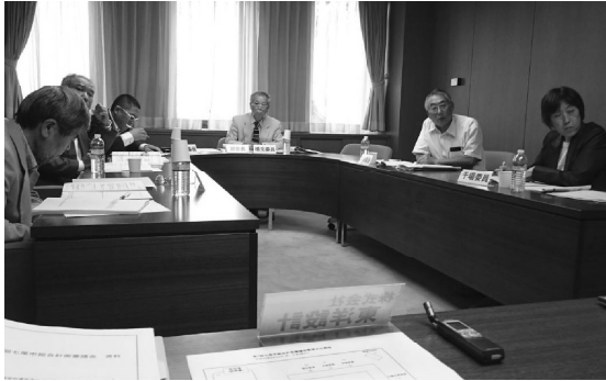
■ 第1回七尾市総合計画審議会 部会 (2017.9)