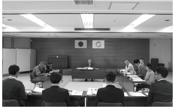
■ 第2回七尾市総合計画審議会 部会 [意見交換会] (2017.10,11)