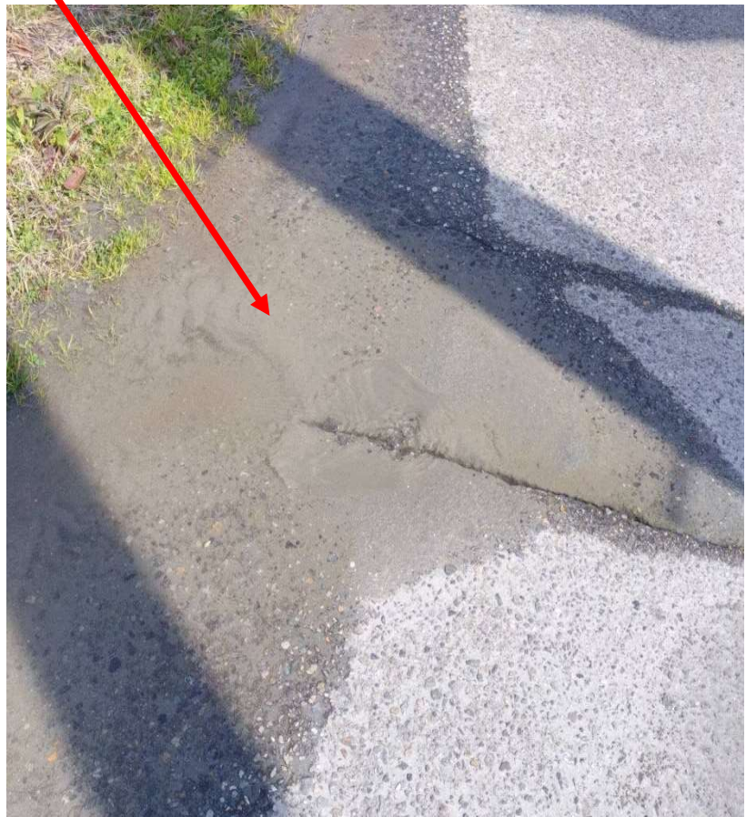
能登島野崎町の漏水調査を行い、漏水箇所を特定しました。