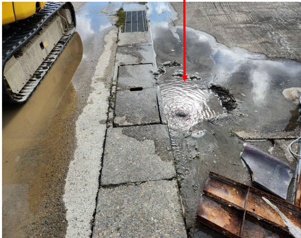
能登島野崎町の漏水調査を行い、漏水箇所を特定しました。