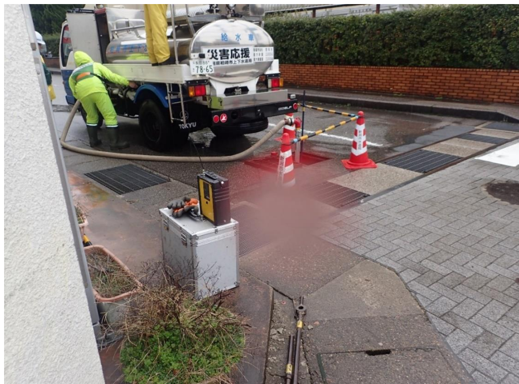
袖ヶ江町近辺で配水管の漏水調査を実施しました（柏崎市）