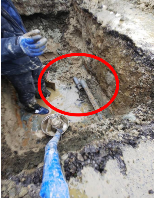
水道管がズレています。