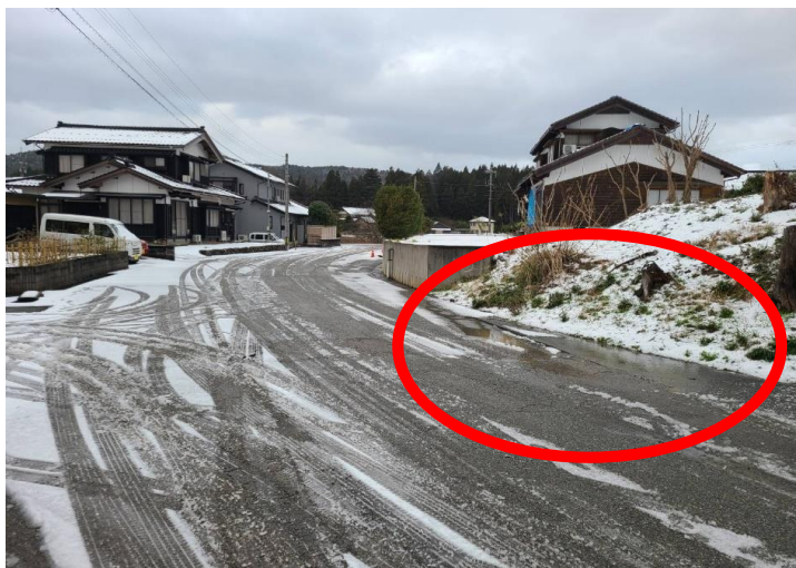
・高田地内での漏水の状況 水を流し、漏水箇所を発見。