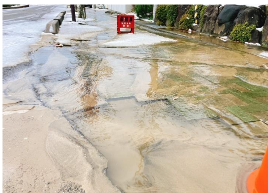
・中島町宮前地内の漏水の状況。プールのように水が溢れました。