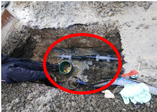
工事完了。水道管がつながりました。