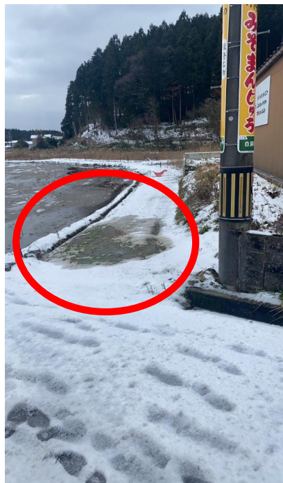
・白浜地内での漏水の状況 水を流し、漏水箇所を発見。