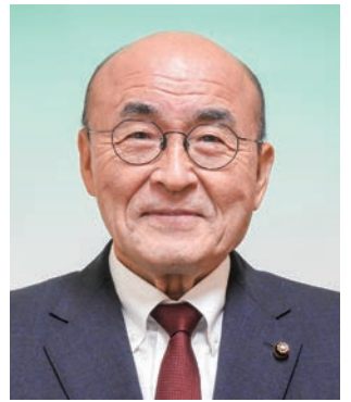
山添 和良 議員 (市民クラブ)

今後被災された方の生活再建を最優先に考え、それぞれの状況に応じた適切な住宅支援に努めたい。