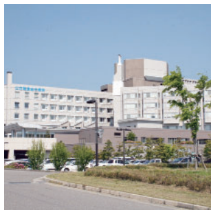
公立能登総合病院