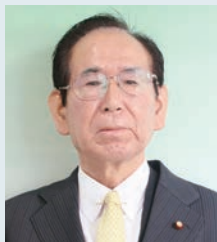
杉本 忠一 議員 (76 歳)