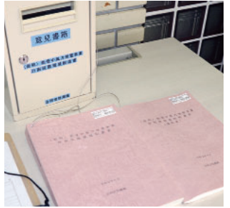
縦覧中の配慮書と意見書箱