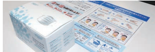
配布された不織布マスク