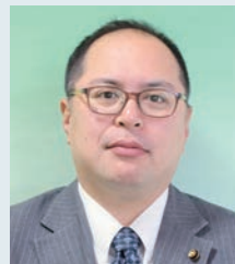
山崎 智之 議員 (41 歳)