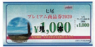
プレミアム商品券 (見本)