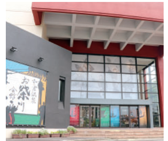
和倉温泉お祭り会館