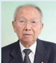
桂 撤男 議員 (81 歳)