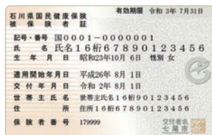
国民健康保険証 (イメージ)