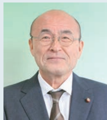
山添 和良 議員 (63 歳)