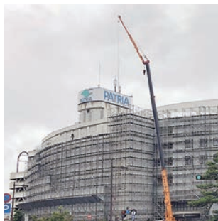
外壁改修中のパトリリア

※6月会議では、新型コロナウイルス感染防止のため、会派内議員の一般質問をできるだけ集約し、代表質問を実施することを申し合わせました。