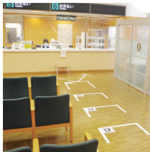
会計前立ち位置表示