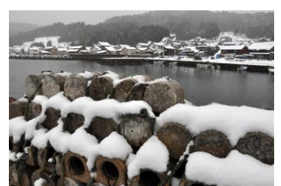
24. 能登島の冬(能登島曲町) 雪の曲漁港