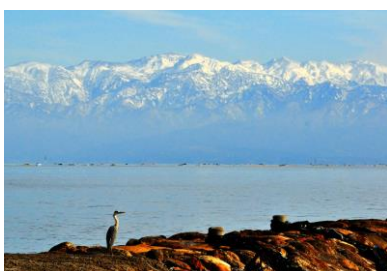
22. 立山遠望(虫崎町) 灘浦海岸と立山連峰