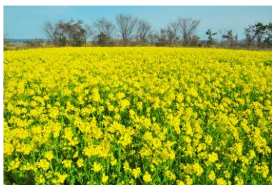
1. 満開の中島菜(中島町中島) 地元野菜の中島菜畑