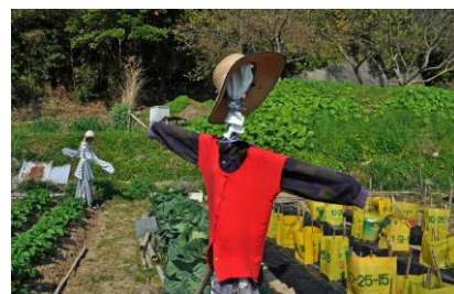
3. 里の春(能登島曲町) 春の畑に案山子