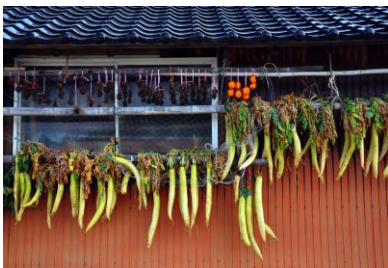
19. 晩秋(能登島閨町) 晩秋に各地で見られる沢庵大根干し