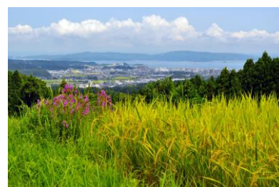
9. 棚田(八田町) 晩夏の棚田より市街地を望む