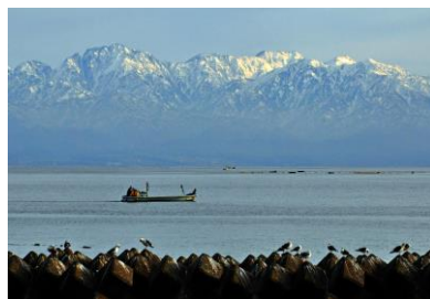
20. 七尾灘浦(大泊町) 灘浦の漁船と立山連峰