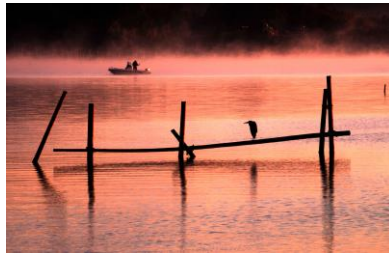
14. け嵐の湾(中島町笠師) 朝霧立つ西湾