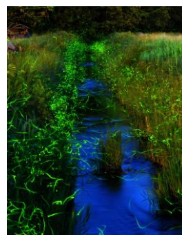
6. 舞螢(大津町) 初夏に舞う螢の群