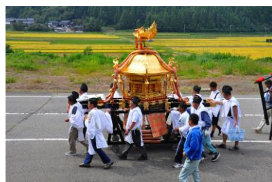
11. 秋祭り(中島町藤瀬) 秋の収穫を祝う神輿卸