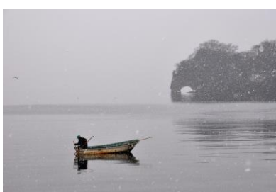
23. 大立崎の冬(松百町) 海鼠漁の小舟