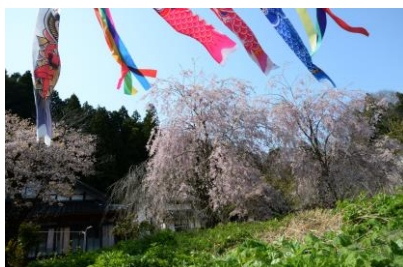
2. 薫風(多根町) 山里の枝垂れ桜