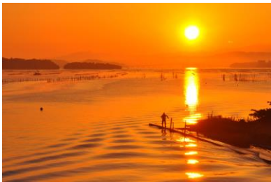
16. 熊来の海(中島町中島) 能登島大橋の上より朝日が昇る