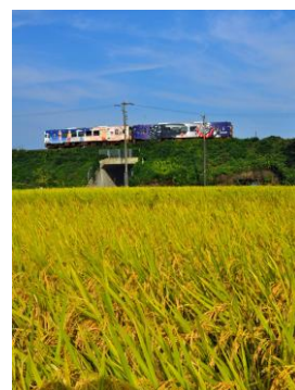
12. 実りの秋(中島町田岸) 収穫まじかの稲田と電車