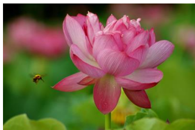
5. 蓮花(松百町) 蓮花咲く