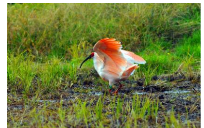
21. 朱鷺(能登島鍛目町) 能登島に舞い降りた朱鷺