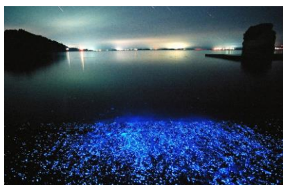
7. 海ホタル(能登島向田町) 能登島の海で見る事ができます