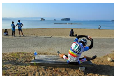
8. 浜辺(能登島佐波町) 能登島海族公園