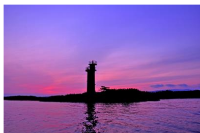
4. 雌島夕景(七尾湾雌島沖) 七尾南湾に浮かぶ雌島の夕景