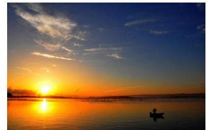
15. 西湾昇陽(中島町中島) 牡蠣の海に朝日が昇る