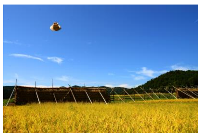
10. 秋晴れ(中島町西谷内) 稲ハザ風景