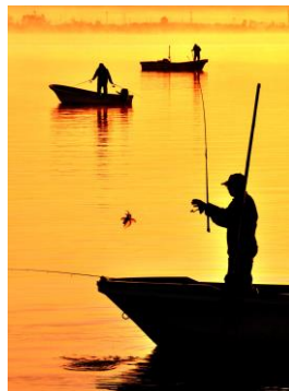
17. 湾の朝(白浜町) 七尾湾、秋の風物詩、タコ釣り