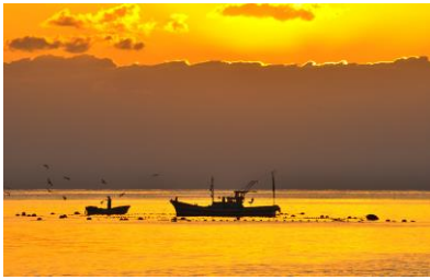
13. 漁の朝(能登島日出ヶ島町) 小口瀬戸で漁をする