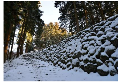
21. 七尾城跡 雪の石垣