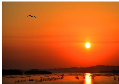
23. 熊来海の朝 朝焼けの西湾