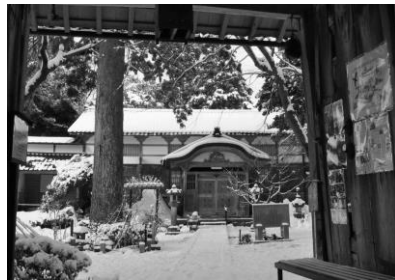
20. 冬の古寺 高山右近ゆかりの寺院