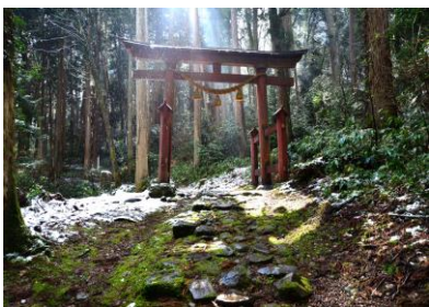
22. 赤蔵の杜 赤倉神社の冬景色