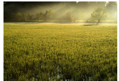
18. 朝靄 晩秋の田圃に朝靄立つ