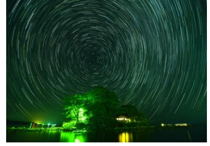
12. 観音島星景 七尾のモンサンミシェル