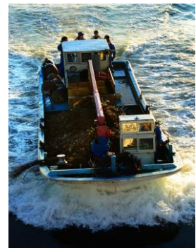
24. 牡蠣漁船 西湾の牡蠣漁船