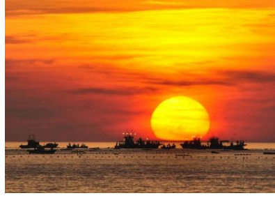
11. 大敷網漁 灘浦の定置網風景