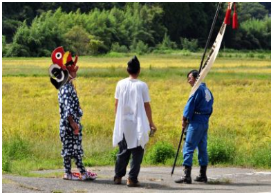
16. 秋祭り 新宮祭の祭り人