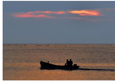
14. 出漁 漁場へ向かう親子船