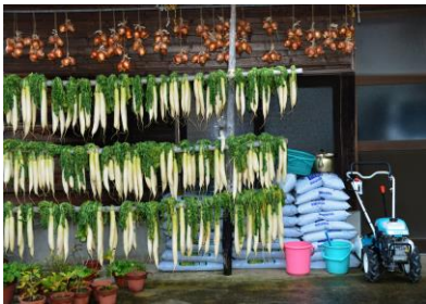
19. 晩秋 晩秋の風物詩大根干し