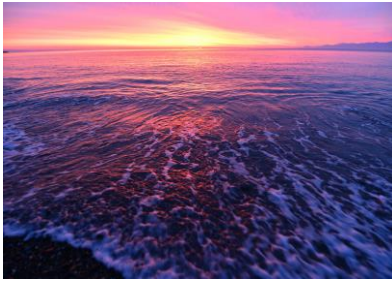
10. 灘浦の朝 朝焼けの海