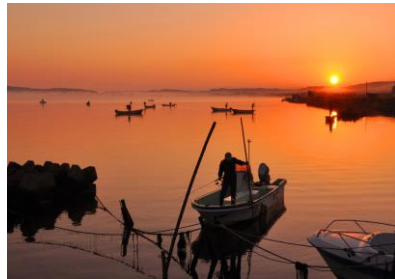
17. 湾の朝 七尾湾秋の風物詩イイダコ釣り