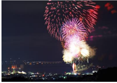
13. 七尾の花火 七尾の夏夜を彩る