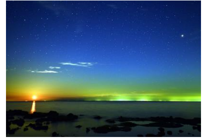
15. 火星と月 火星大接近の夜