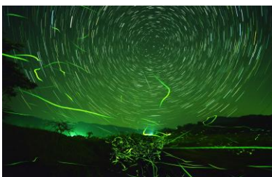
10. 舞蛍 里山に蛍舞う