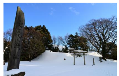
21. 七尾城址 雪の七尾城址