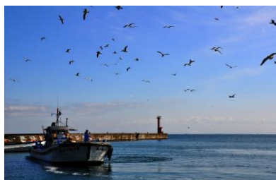
23. 佐々波漁港 帰漁船とカモメ