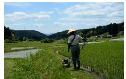
12. 棚田 畦草刈り作業