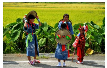
18. 新宮祭 鉾打地区の杵旗祭り