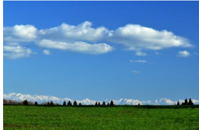
2. 早春の丘 春の牧草地