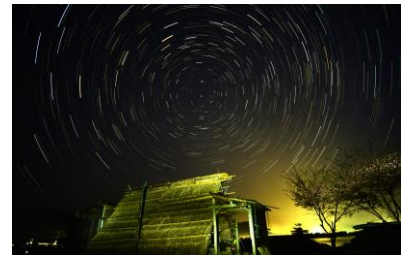
6. 長崎の夜 夜の塩づくり舟小屋