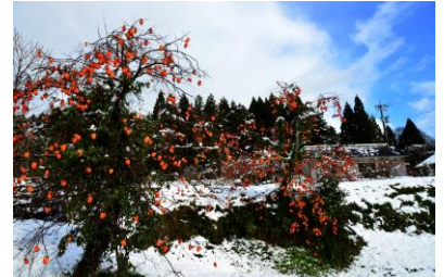
24. 残り柿 柿に雪