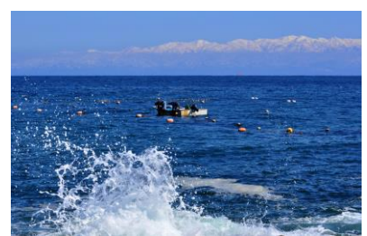
9. 立山遠望 七尾灘浦海岸