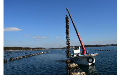
3. 牡蠣漁 牡蠣漁の船