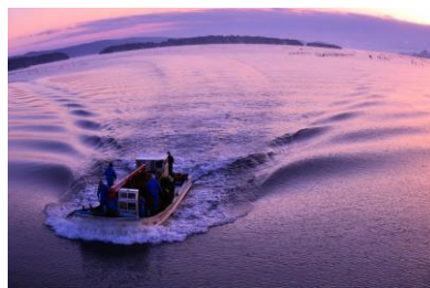
20. 熊来海の朝 帰漁の牡蠣船