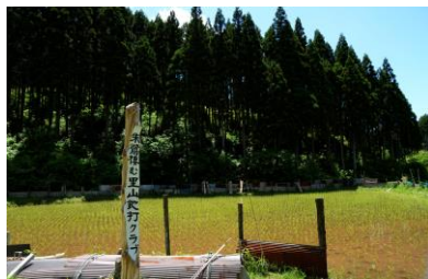
11. 朱鷺待つ里山 以前朱鷺が舞っていた須久保