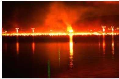
14. かがり火恋まつり 海で行われる幻想的な恋まつり