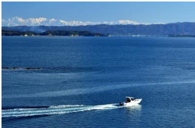
1. 早春の西湾 西湾の背景に立山連峰