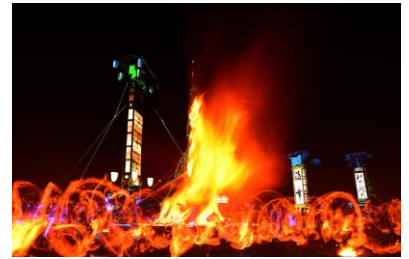
15. 能登島火祭 島の夏夜を彩る祭り