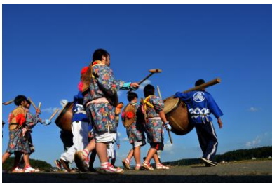
19. 六保祭 豊川地区の杵旗祭り