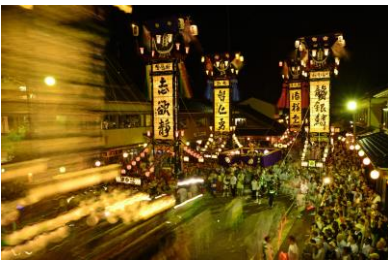
16. 石崎奉燈祭 漁師町の熱い祭り