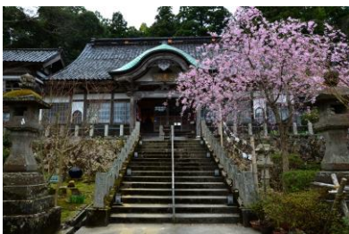
7. 春の古寺 春の青林寺