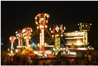
13. 祇園祭 大地主神社の奉燈祭