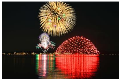
17. 和倉夏花火 三尺玉の競演