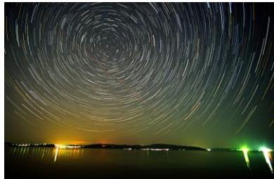
5. 能登島夜曲 能登島星景