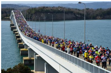
4. ランナー 能登和倉万葉マラソン