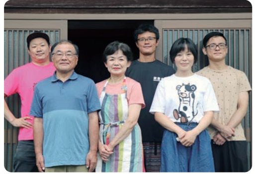
有限会社 くぼちゃんパン

毎日の日課は、朝1時半から仕込みが始まるパン作り。パンは安心、安全な材料で喜んでもらえるよう生産しています。担当は、母と次男、三男が行い、お昼前に配達先へ納入。乳牛の搾乳は、朝6時から10時と夕方5時から夜8時半に父と長男、長男の妻が行い業者に納入しています。