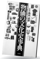
「物価の文化史事典」 森永 卓郎 編 展望社

明治・大正・昭和・平成 米価から総理大臣の給与まで 近代日本100年の物価の推移がひとめでわかる一冊