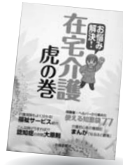
「お悩み解決！在宅介護虎の巻」 北國新聞社 編/北國新聞社

明治・大正・昭和・平成 米価から総理大臣の給与まで 近代日本100年の物価の推移がひとめでわかる一冊