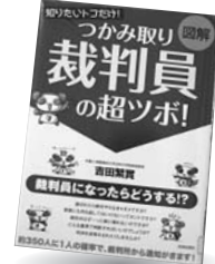
「図解「裁判員」の超ツボ」 吉田 繁寛/青春出版社

体の不自由な人の介護のコツ、認知症の対処の大原則、福祉サービス案内など在宅介護に役立つ知識を紹介