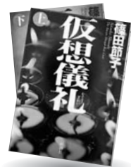
「仮想儀礼 上・下」 篠田 節子 新潮社

実際に裁判員に参加した場合、裁判員は何をするのか、どのようなことにつけなければならぬのか、などをわかりやすく説明