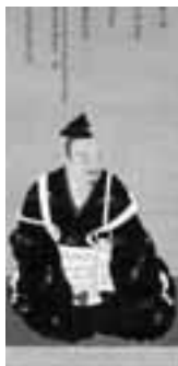
町文「畠山義親画像」能登町萬福寺蔵