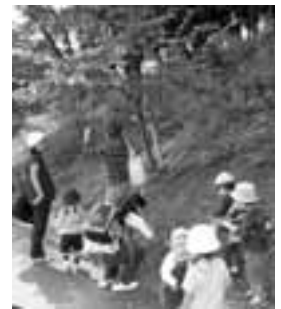
昨年の「秋みつけ」の様子

遊びの教室<自然物で遊ぼう～笹舟づくり～> 笹の葉って、こんなにおい?(今年の様子)