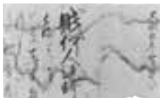
県文「賦何人連歌」(部分)

能登畠山氏は室町時代から戦国時代までの約170年間にわたって能登国を統治した大名で、能登地方の歴史や文化に大きな足跡を残しました。今年が「能登畠山氏創立600年」であることを記念して、本展では能登畠山氏に関する様々な作品や資料など、地元伝来の品々を中心に紹介しています。