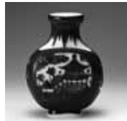
白地藍被蓮池樓閣文扁壺 18世紀

中国清時代に作られた独特な色彩のガラス器をはじめ、嗅ぎ煙草を入れた小さなガラス壺など、収蔵品約140点を一挙に展示します。