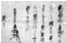
市文「畠山義綱判物」七尾市龍門寺蔵