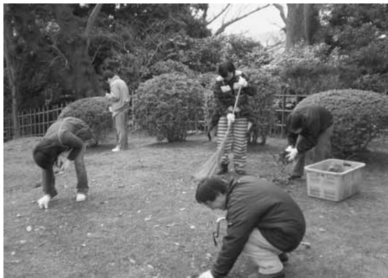
地域の方と清掃作業に精を出すメンバーたち

この協議会は身体・知的・精神に障害がある方々が、障害があっても地域で安心して住める街づくりを目指して活動しています。