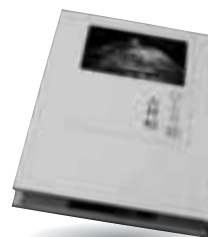
「ひとり旅」 吉村 昭 文藝春秋社