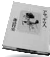
「アサッテの人」 諏訪 哲史 講談社