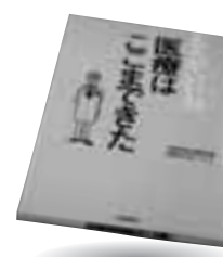
「丈夫がいいね 医療はここまで来た」 北國新聞社 北國新聞社