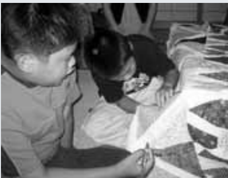
御祓・西湊地区子ども会で。みんな楽しく参加。