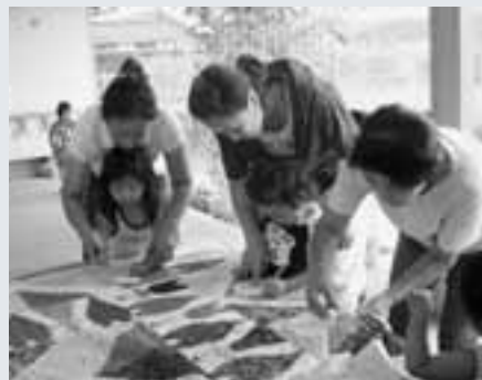
中島保育園で。暑さも忘れて・・・。