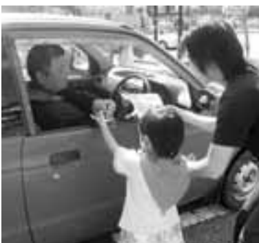
交通安全マスコットの配布