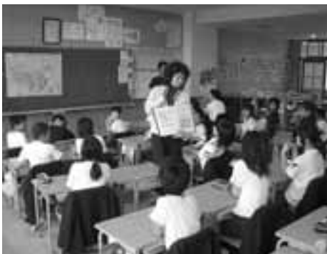
異文化交流の授業の様子です。

最初の心配と不安もだんだんなくなり、充実した毎日を送っています。これからは、中国についてのイベントもやります。自分の力が少しでも七尾の皆さんの役に立てばいいなあと思っています。 地震に負けず頑張っている、七尾の皆さんの元気な姿と明るい笑顔を見て、嬉しく思いました。七尾の復旧を心から祈ります！ この一年間、美しい七尾の皆さんと共に頑張ります！ (。)