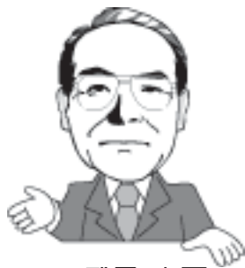
七尾市長 武元 文平