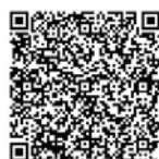
七尾市電子申請 サービス