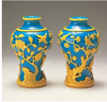
青地黄被花鳥文瓶

乾隆(けいりゅう)ガラスとして知られている清朝(1644~1911)のガラスは、皇帝のための華麗な宮廷芸術です。異なった色ガラスを重ね合わせて浮き彫りを施した色あざやかな作品は、気の遠くなるような時間をかけた手作業で制作されています。