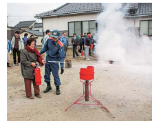
自主防災組織の防災訓練