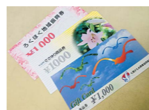
現在ある地域商品券