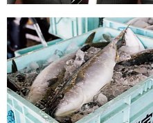
1次産業となる漁業