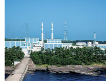
志賀原発