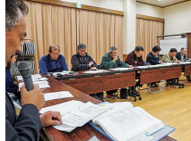
事前説明会の様子