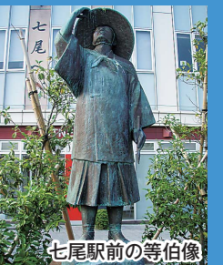
七尾駅前の等伯像

北陸新幹線の金沢開業、能越自動車道・七尾氷見道路の全線開通を控え、等伯生誕の地・七尾のPR事業を支援し、等伯立像の建立をするもの。