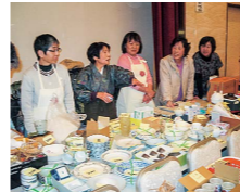
市内で活躍する女性団体