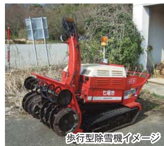
歩行型除雪機イメージ

あります。非常に有意義なことだと考えています。地域での自主的な除雪の意向などもしっかりと確認をさせていただきながら、モデル事業として除雪機の購入について支援ができるかどうか、前向きに検討していきたいと考えています。