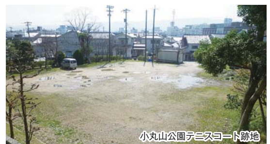
小丸山公園テニスコート跡地