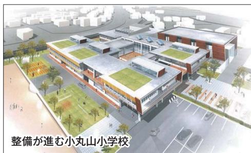
整備が進む小丸山小学校