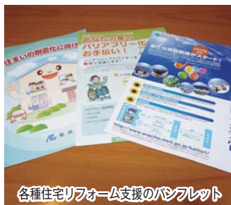
各種住宅リフォーム支援のパンフレット