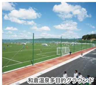
和倉温泉多目的グラウンド

道の全線開通なども見据えながら、首都圏での誘客事業を来年度から強化していきたいと考えています。実施に当たっては、県、県観光連盟、能登半島広域観光協会などと連携していきます。また、旅行会社などを招へいして、新たな観光資源の発掘や旅行商品の開発にも努めていく考えです。