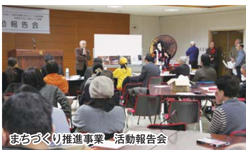
まちづくり推進事業 活動報告会