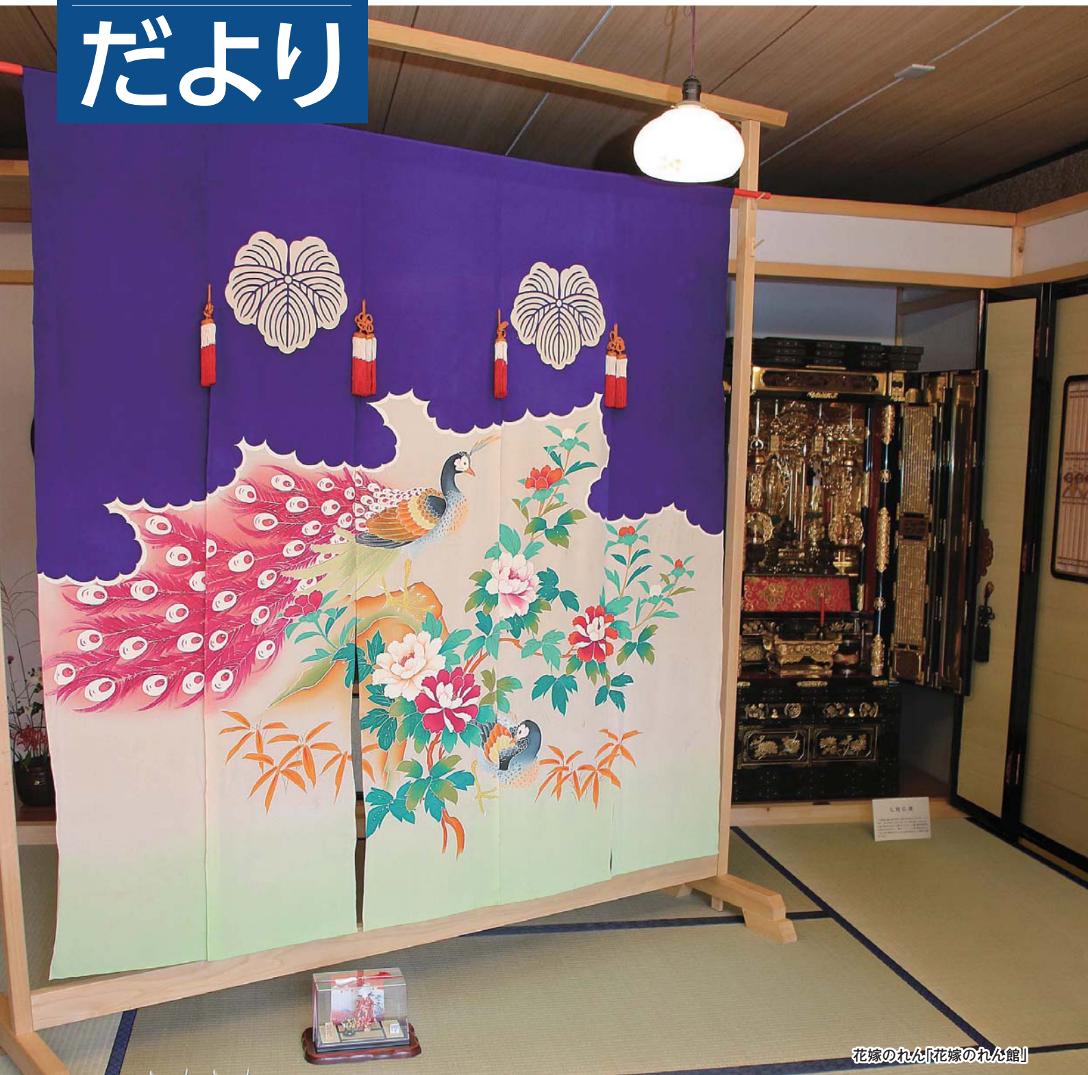
花嫁のれん「花嫁のれん館」