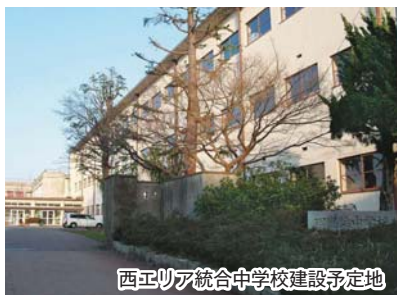
西エリア統合中学校建設予定地

れていた、七尾の未来を担う子どもたちにより良い学習環境の場を提供するため、早期に統合中学校の実現を果たしたいという熱い思いに、私も感じ入ったところ。西エリア統合中学校をできるだけ早く実現し、耐震化対策と適正規模、適正配置による充実した教育環境及び安全安心な教育環境のもとで、生徒も教員も切磋琢磨しながら質の高い教育の実現を