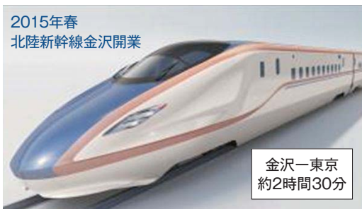
2015年春 北陸新幹線金沢開業