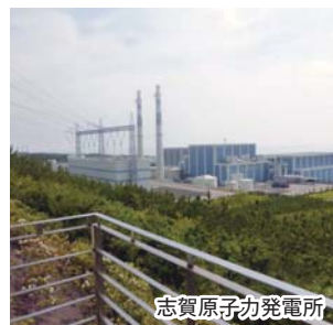
志賀原子力発電所