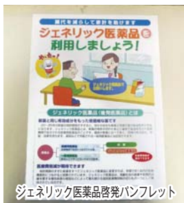
ジェネリック医薬品啓発パンフレット

しています。今後の取り組みとして、対象者の課題に応じた保健指導を強化し、医療機関との連携を進めたいと思います。また、これまで実施している重複服薬者、多受診者の訪問指導等に加え、25年度には試行的にジェネリック医薬品差額通知事業に着手し、医療費の抑制に努めることとしています。