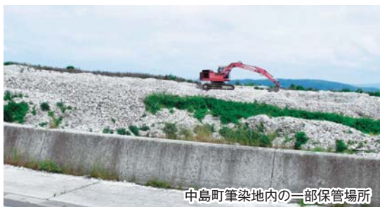
中島町筆染地内の一部保管場所