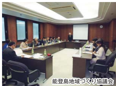
能登島地域づくり協議会

めて整理をお願いしたいと思っています。市でも地域で取り組んでいただく望ましい事務事業は何なのか、整理を行っていきたいと思っています。25年度早々には地域の皆さんと行政が互いの思いを持ち寄って、いわゆるキャッチボールのできる協議の場を設けたいと考えており、具体的な行動に発展させて、協働のまちづくりを進めていきたいと思っています。