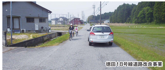
徳田18号線道路改良事業