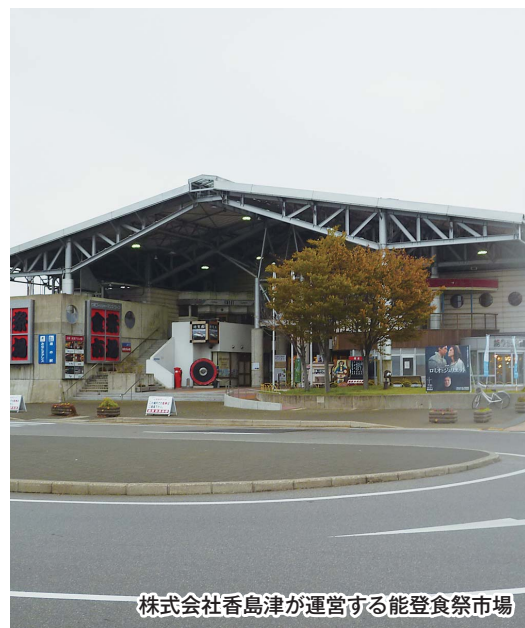
株式会社香島津が運営する能登食祭市場