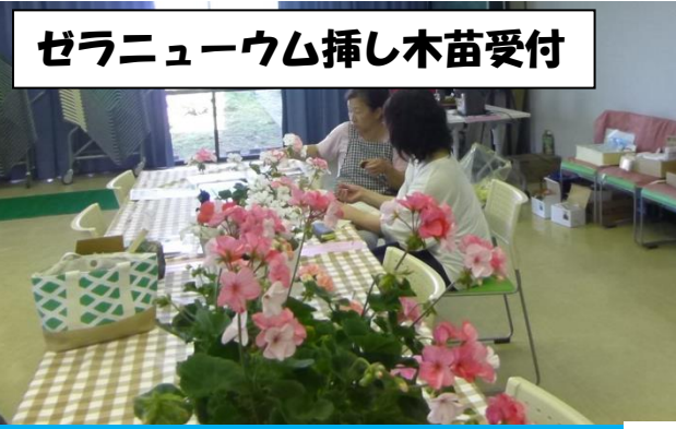
ゼラニューウム挿し木苗受付