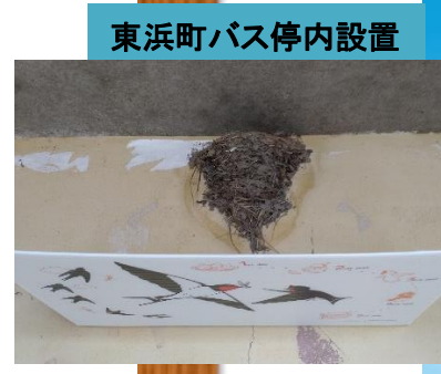
東浜町バス停内設置

ツバメは、「幸せを運ぶ鳥」、 「巣を作る家が栄える」と 昔から人家での巣作りを 歓迎されてきた鳥です。