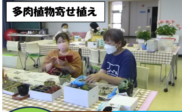
多肉植物寄せ植え