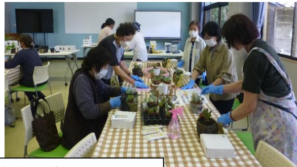
多肉植物寄せ植え